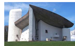
A (a mitjan segle XX)

C - Michael Thonet. Cadira núm. 14 o Cadira Thonet, (1854), primer moble de disseny industrial / B - Fritz Lang. Metropolis (1927), cinema expressionista alemany / A - Le Corbusier. Notre-Dame du Haut , Ronchamp (1953-1955), arquitectura orgànica.