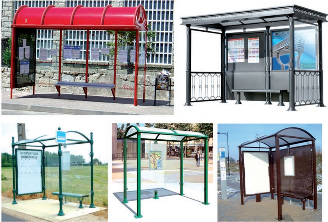
IMATGE C. Exemples de marquesines, totes amb una gran estabilitat

En la imatge C podem veure diverses marquesines que serveixen per a protegir-se de les inclemències del temps i que habitualment es col·loquen en les parades d'autobús.