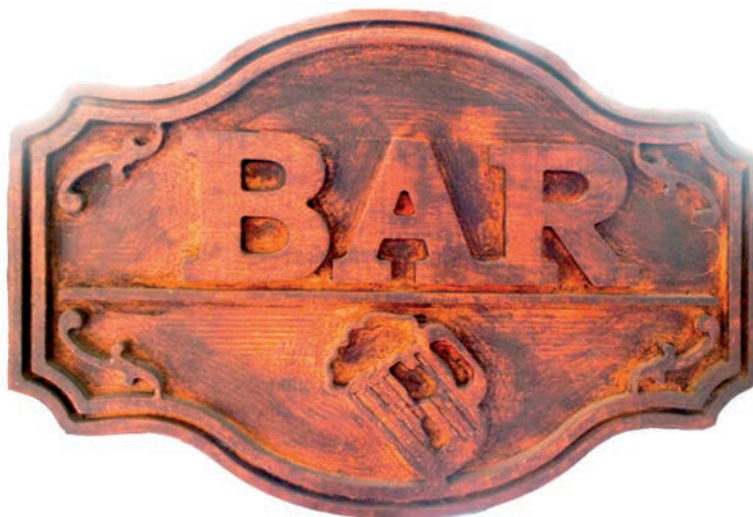
IMATGE E. Rètol actual que els propietaris volen redissenyar

Dissenyeu un rètol d'acord amb les indicacions esmentades i anoteu l'escala emprada.