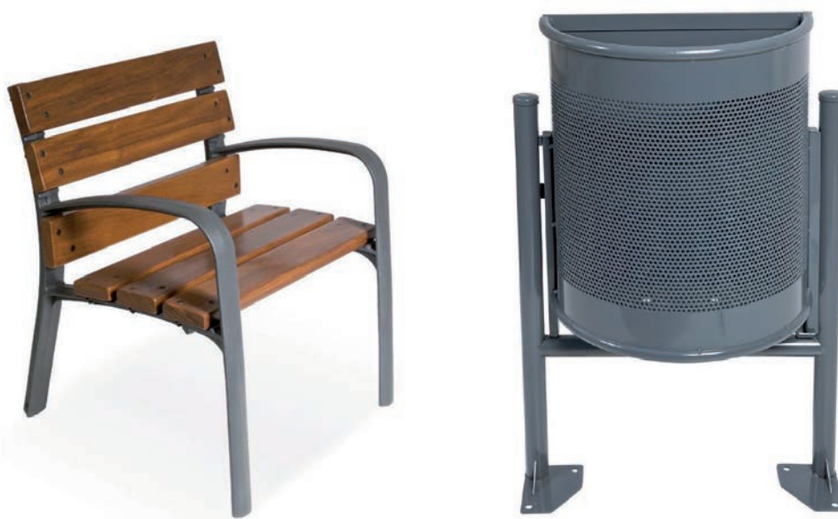
IMATGE A. Banc individual i paperera antiadhesius

Adaptació feta a partir del text de Vega S. SÁNCHEZ. «Com els governs municipals utilitzen el disseny per canviar les ciutats». El Periódico [en línia] (14 setembre 2016)