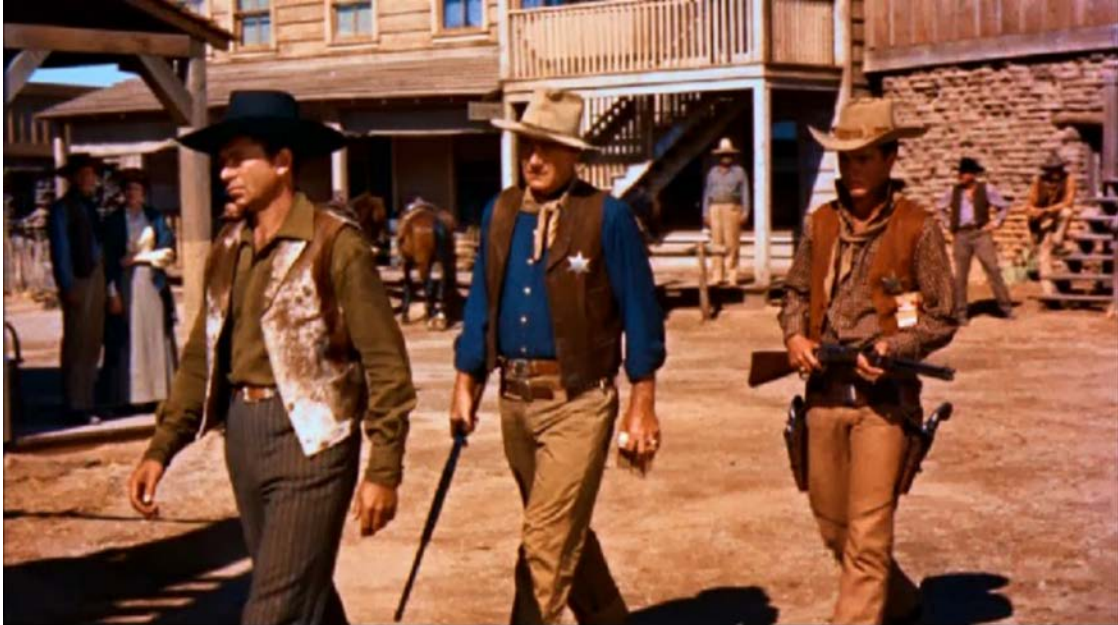
Fotograma de Río Bravo (1959), de Howard Hawks.

Observeu atentament el fotograma següent de la pel·lícula Río Bravo (1959), de Howard Hawks, i responeu a les qüestions 2.1, 2.2 i 2.3.