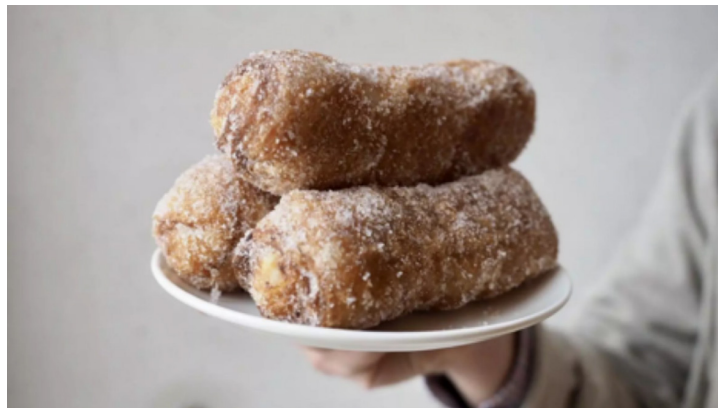
IMATGE F. Xuixo guanyador, de la pastisseria Juhé

La imatge F mostra el xuixo guanyador del Fòrum Gastronòmic Girona 2022, que va ser guardonat per la qualitat de la crema, l'aspecte interior (massa, esponjositat, cocció), la qualitat del fregit i el gust equilibrat.