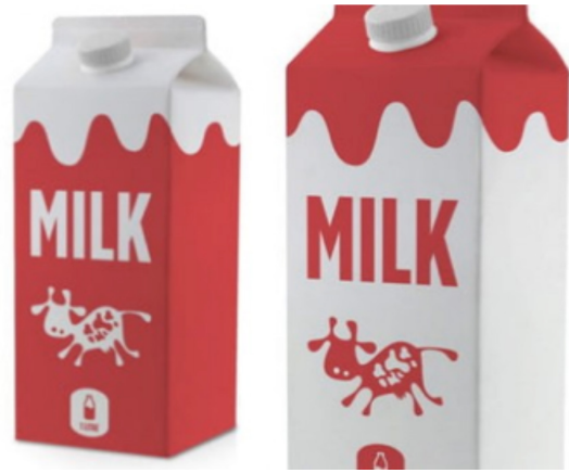
IMATGE D. Envàs actual de Tetra Brik ® , en forma de prisma rectangular

Observeu les imatges C i D i responeu a les DUES qüestions següents: