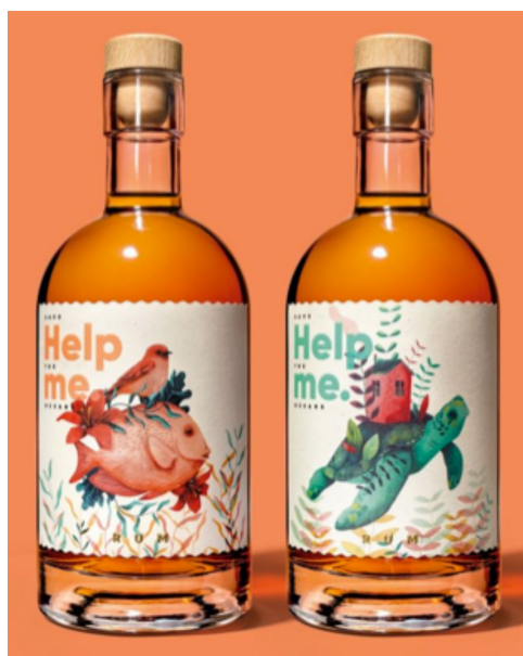
IMATGE B. Etiqueta de paper ecològic (Crush Citrus FSC) elaborat amb un 15 % de pasta de cítrics i un 40 % de fibres reciclades

Observeu les imatges A i B i responeu a UNA de les dues qüestions següents: