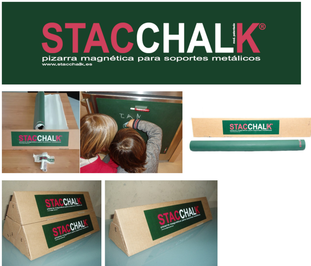
IMATGE E. Etiqueta, producte i packaging de la pissarra magnètica Stacchalk

Stacchalk (imatge E) és un producte de disseny català. Es tracta d'una pissarra magnètica lleugera i flexible que es pot col·locar a la nevera, la campana extractora o qualsevol altre suport metàl·lic, i serveix per a prendre nota d'encàrrecs o estimular la creativitat dels més petits de la casa. És fàcil de fer servir i té unes petites incisions per a subjectar-hi el guix o el retolador que s'utilitzarà per a escriure-hi o dibuixar-hi. A més, com que a diferència del paper no és d'un sol ús, és respectuosa amb el medi ambient. Inclou guix i portaguixos, es pot retallar a voluntat amb unes simples tisores i es fabrica en dos formats diferents: 57 × 57 cm i 25 × 30 cm.