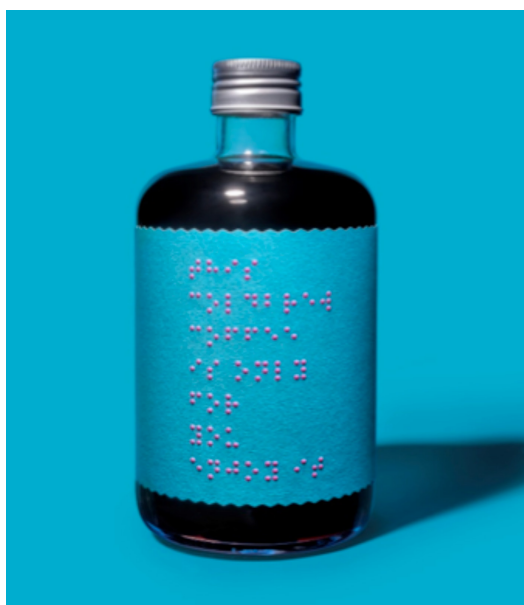
IMATGE A. Etiqueta de paper ecològic (Naturel Blanc FSC) elaborat amb un 100 % de fibres reciclades

L'agència de branding i packaging Supperstudio, reconeguda com a agència de l'any als Pentawards 2021, i la multinacional Avery Dennison s'han unit amb l'objectiu d'inspirar altres marques perquè construeixin amb valors i així contribueixin a fer un món millor. Aquests projectes volen donar visibilitat a col·lectius desfavorits i difondre la necessitat de preservar mars i oceans, des del disseny i la innovació, tot emprant recursos sostenibles.