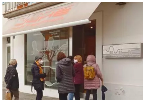
IMATGE G. Logotip de la pastisseria Juhé sobre una peça de xocolata i al rètol de la paret de l'establiment