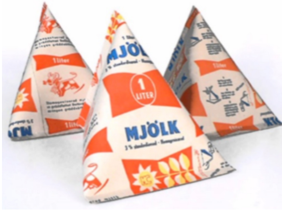
IMATGE C. Envàs original de Tetra Classic ® , en forma de tetraedre

Tot i la revolució que va suposar a finals de la dècada de 1950 el seu primer envàs per aconseguir que no es fes malbé la llet, Ruben Rausing i l'equip directiu de Tetra Pak es van adonar que calia que el disseny fos més rectangular perquè l'envàs continués sent competitiu (imatge D).