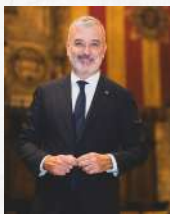
Jaume Collboni Cuadrado L'Alcalde de Barcelona