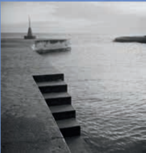
Joaquín Tusquets de Cabirol, Port, Barcelona, febrer/març de 1952.

Activitat oberta: cal inscripció prèvia al Casal de Barri (cb@aavv-vilaolimpica.com o 932219522)