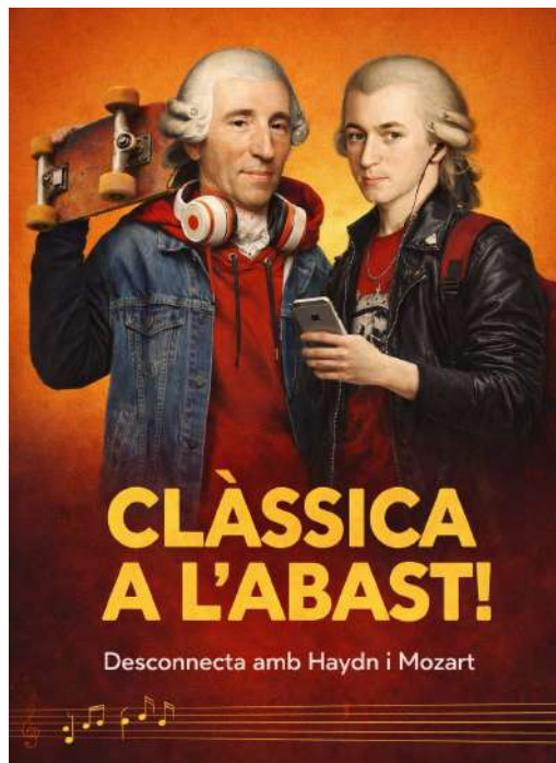
Imatge generada per intel·ligència artificial (IA)

Heu començat a col·laborar amb el departament educatiu d'una orquestra simfònica que vol proposar un cicle de concerts per a adolescents, amb l'objectiu d'acostar la música clàssica als joves, a partir de la imatge de campanya que es mostra a continuació.