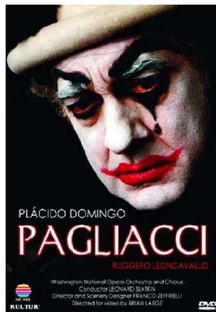
FIGURA 4. Pagliacci , de Ruggero Leoncavallo