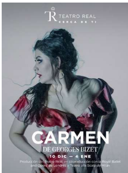
FIGURA 3. Carmen , de Georges Bizet