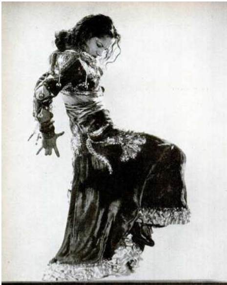
Carmen Amaya ballant

Esteu treballant en una consultoria cultural que assessora una important marca de moda que vol inspirar-se en referents històrics del flamenc per a encetar una nova línia creativa que connecti la tradició flamenca amb la moda contemporània. Volen conèixer de primera mà la figura de Carmen Amaya per a analitzar el seu estil i la seva força escènica, i plasmar-los en un nou disseny de vestuari.