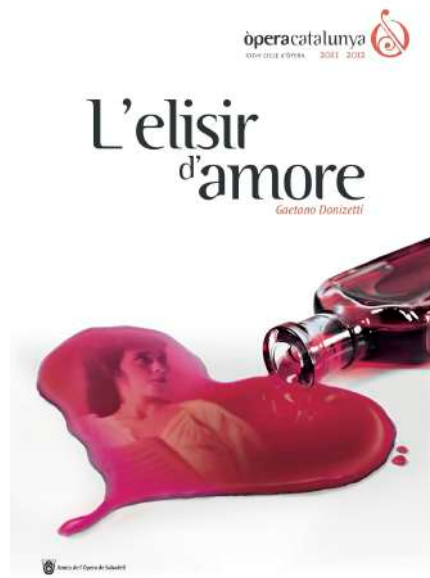
FIGURA 2. L'elisir d'amore , de Gaetano Donizetti